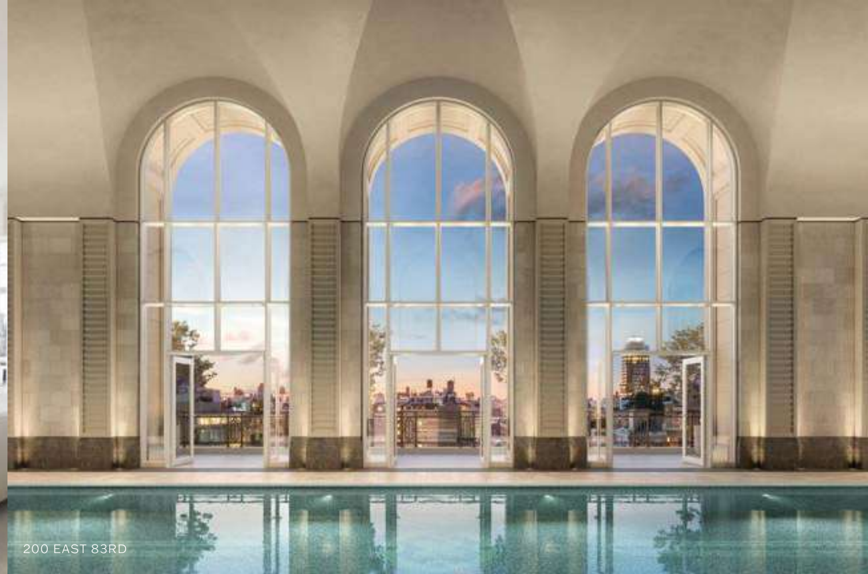
200 EAST 83RD