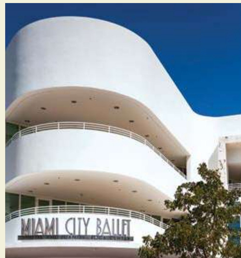
MIAMI CITY BALLET, MIAMI BEACH