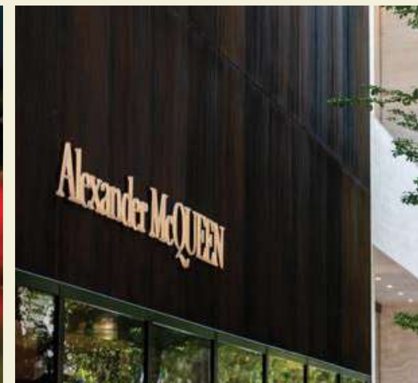
ALEXANDER MCQUEEN, DESIGN DISTRICT