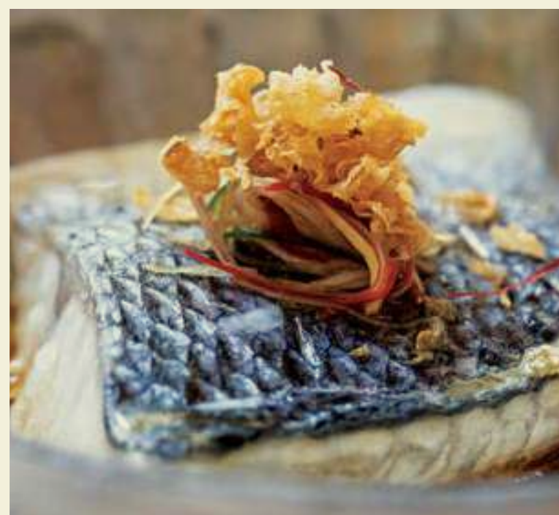
SEXY FISH MIAMI