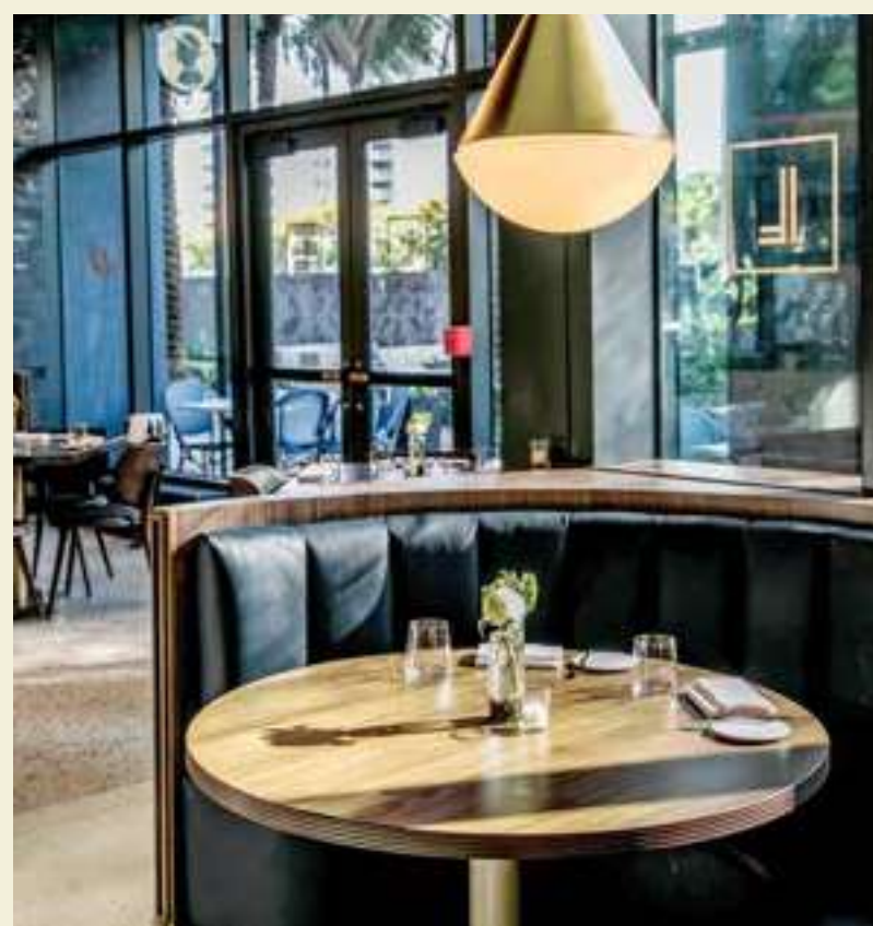
BRASSERIE LAUREL, MIAMI WORLDCENTER

O cenário gastronômico em constante evolução de Miami abrange desde restaurantes locais até restaurantes aclamados, servindo culinárias tão diversas quanto as pessoas que visitam a cidade. Mais de uma dúzia de restaurantes com estrelas Michelin estão bem pertinho da JEM. Quando concluído, o Miami Worldcenter abrigará mais de 30 restaurantes, incluindo vários de chefs de renome mundial