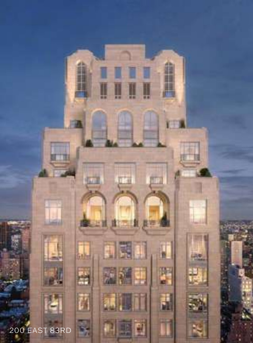
200 EAST 83RD