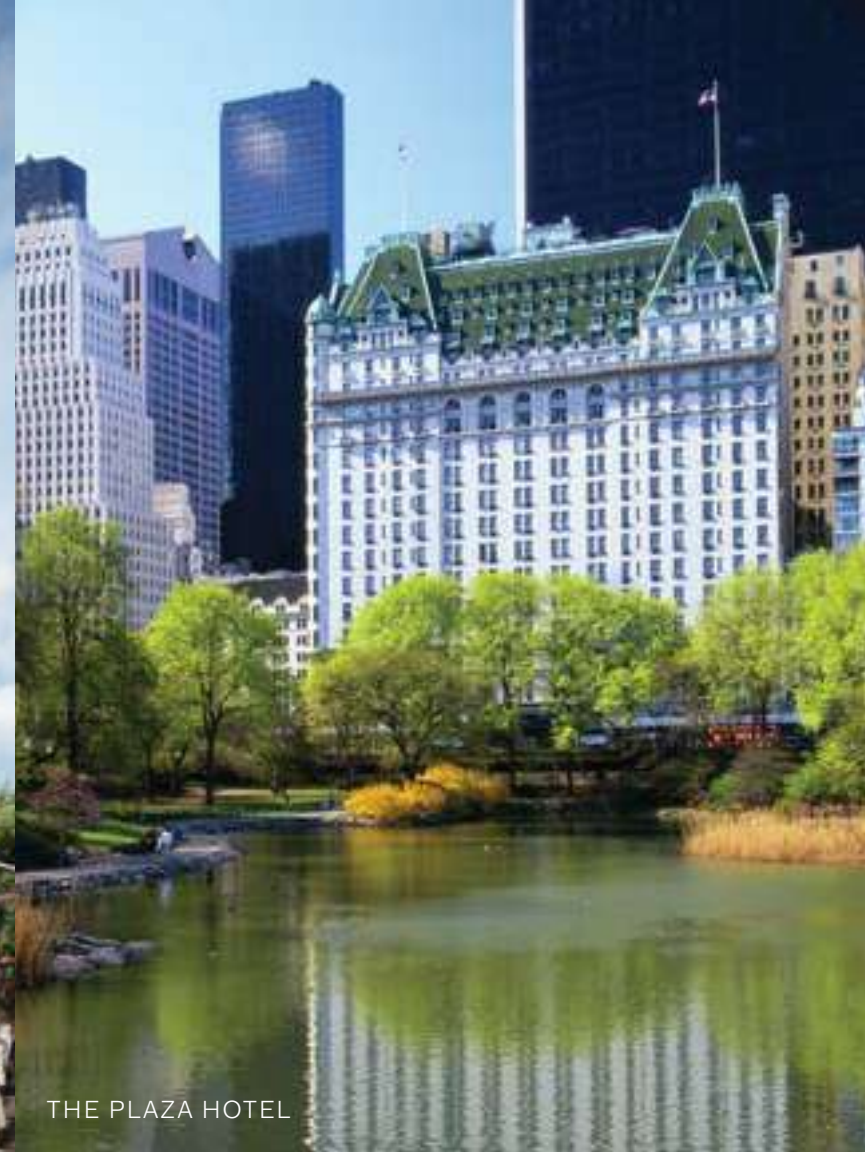
THE PLAZA HOTEL