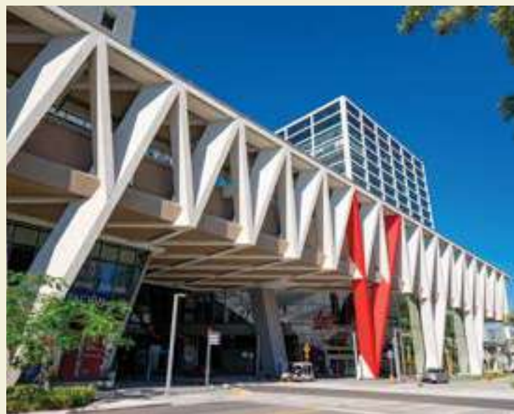
NA PARTE DE CIMA: Miami Metromover; MEIO: Brightline; NA PARTE DE BAIXO: Estação Ferroviária Central de Miami