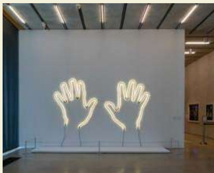
NA PARTE DE CIMA: Wynwood Walls; MEIO: Penetrável Macaléia de Hélio Oiticica no Pérez Art Museum Miami; NA PARTE DE BAIXO: Notes for a Poem on the Third World, Glenn Ligon, Pérez Art Museum Miami