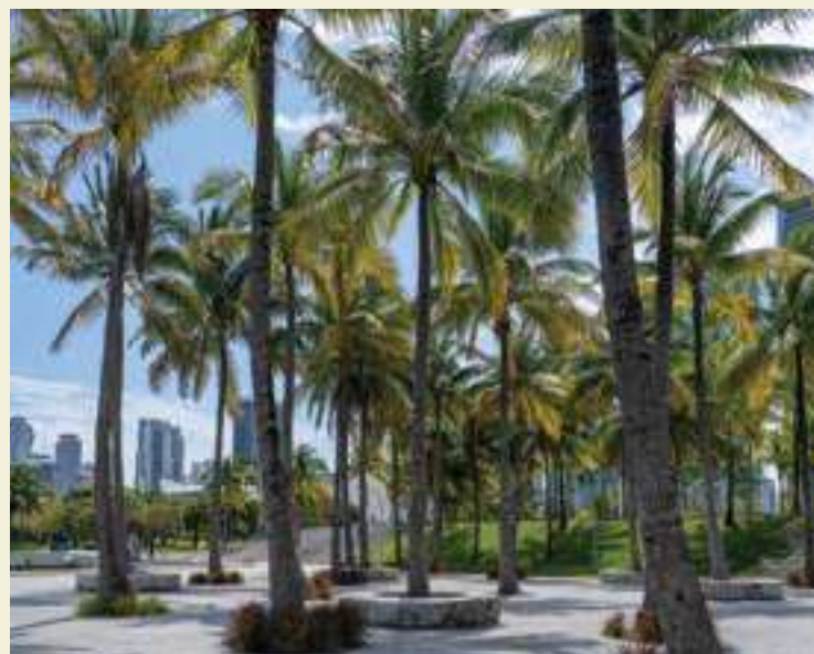
NA PARTE DE CIMA: Miami Beach Golf Club; NO MEIO: South Beach; NA PARTE DE BAIXO: Maurice A. Ferré Park Baywalk