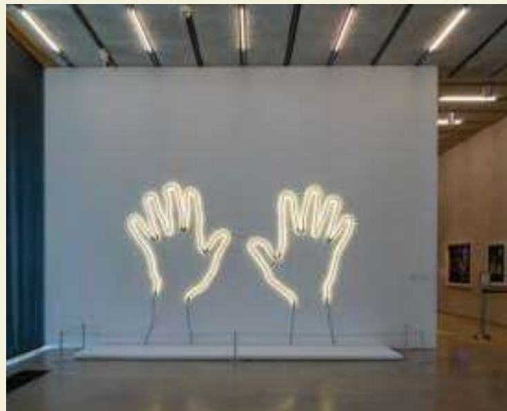
ARRIBA: Wynwood Walls; CENTRO: Penetrável Macaléia, de Hélio Oiticica, Pérez Art Museum Miami; ABAJO: Notes for a Poem on the Third World, de Glenn Ligon, Pérez Art Museum Miami