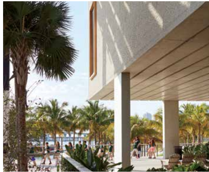
МУЗЕЙ ИСКУССТВ ПЕРЕСА – МАЙАМИ