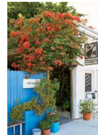
РЕСТОРАН MANDOLIN AEGEAN BISTRO