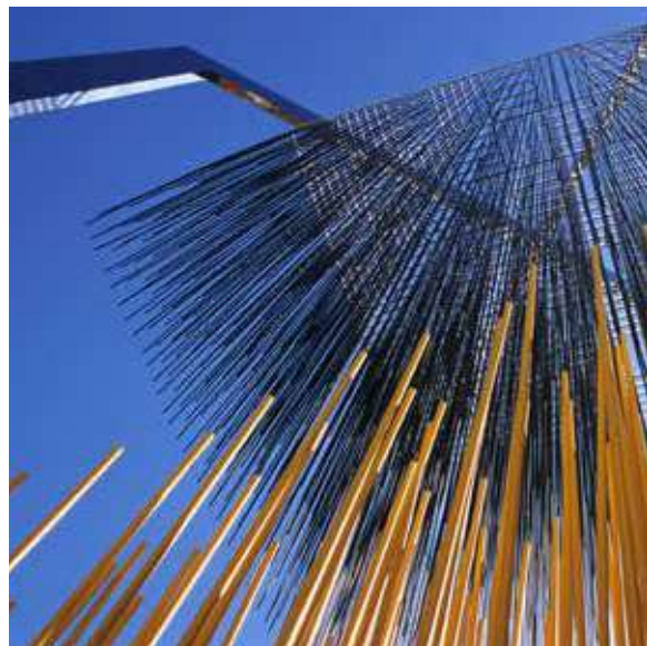
JESUS RAFAEL SOTO