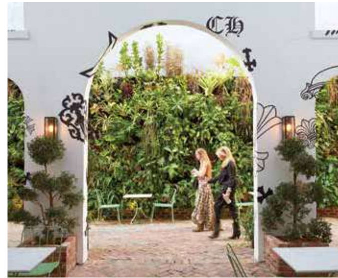
ТОРГОВЫЙ ЦЕНТР CHROME HEARTS