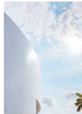
СТАДИОН AMERICAN AIRLINES