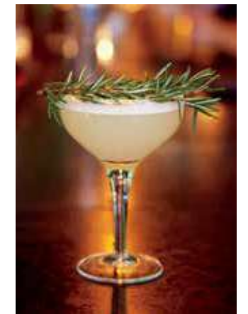
РЕСТОРАН CYPRESS TAVERN